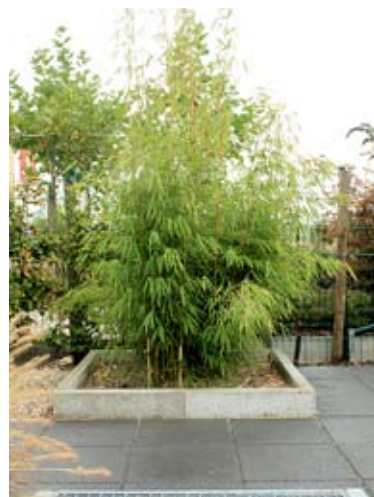
In het verlengde van de zwevende bak ligt een verhoogd plantvak met bamboe (1).