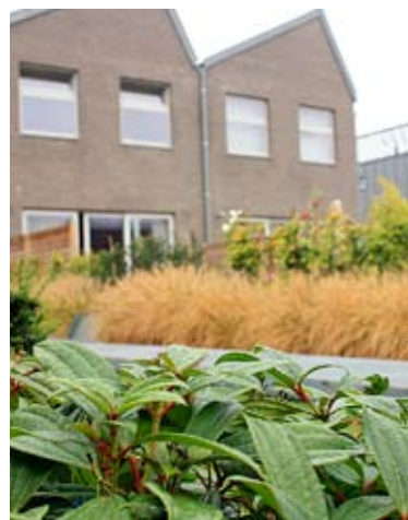
De wintergroene Viburnum davidii (4) vormt een fraai contrast met het lichtbruine siergras op de achtergrond.